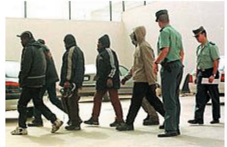
Menores no acompañados interceptados en Andalucía.

La ley impide una expulsión inmediata y, dado que suele ser imposible localizar a sus padres o tutores, obliga a su acogimiento en instituciones públicas pero, según estudios recientes, se ha sabido que Andalucía es la comunidad más afectada por este problema. En 1999 se gastó