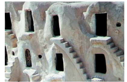
Gorfás, (antiguos graneros) en Matmata.

que desplazarse —pueblos enteros— cada tantos años, huyendo de las implacables arenas que todo lo invaden. Los tunecinos luchan contra el avance del desierto, pero el Sáhara siempre gana.